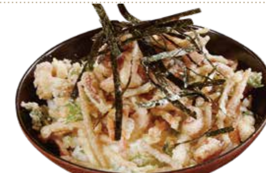
いかげそ天丼セット 920円【税込】