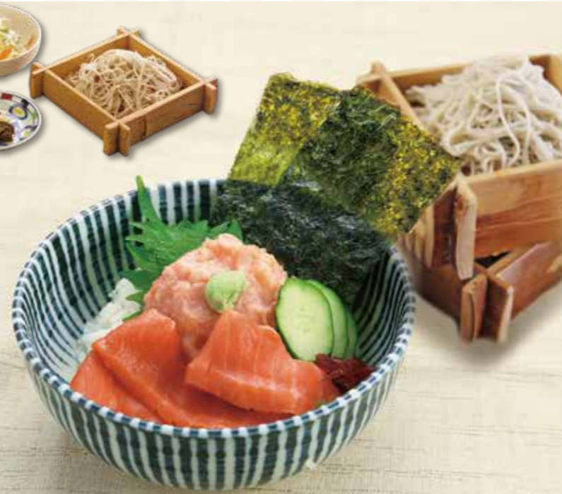
鮭とろサーモン丼セット 1,440円【税込】