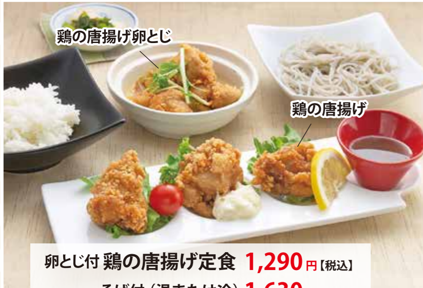
卵とじ付 鶏の唐揚げ定食 1,290円【税込】 そば付 (温または冷) 1,630円【税込】