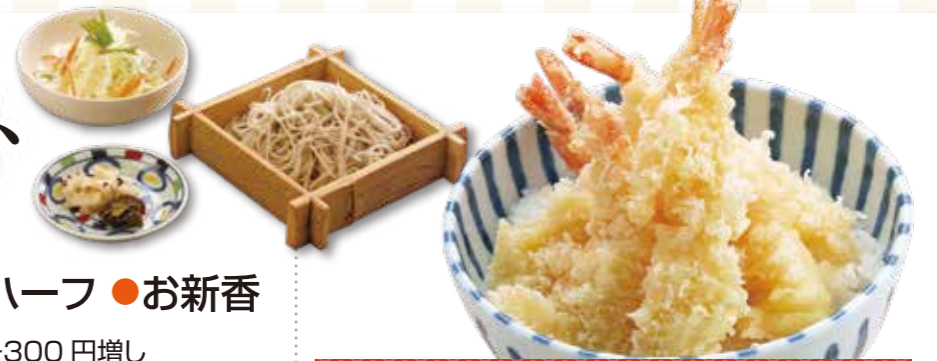
海老天丼セット 1,370円【税込】

●サラダ ●そばハーフ ●お新香 ※そば大盛りの場合は +300円増し ※おそばは温・冷が選べます。