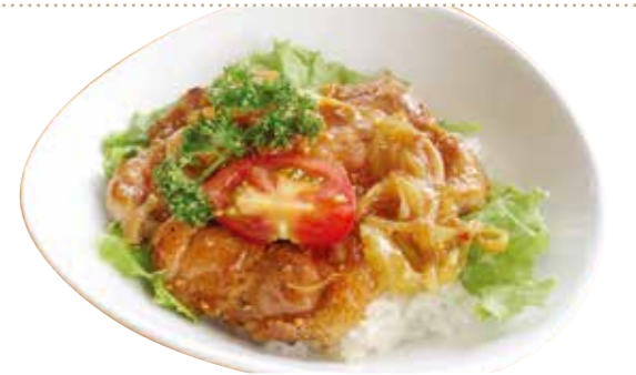
豚焼き肉丼セット 1,240円【税込】