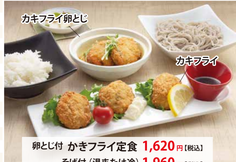
卵とじ付 かきフライ定食 1,620円【税込】 そば付 (温または冷) 1,960円【税込】