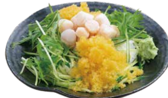
バラ数の子小柱丼セット 1,240円【税込】