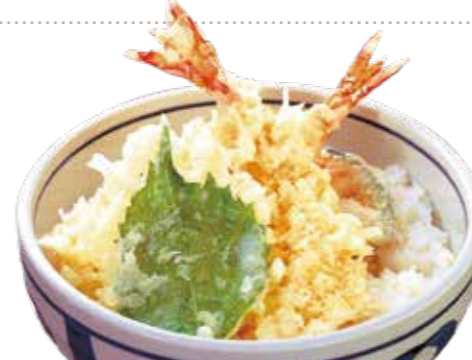
天丼セット 1,130円【税込】