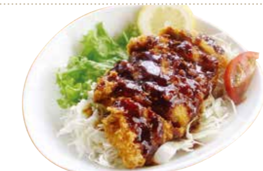
ソースかつ丼セット 1,260円【税込】