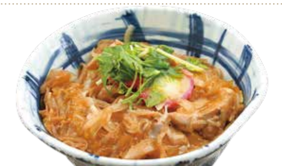
親子丼セット 1,160円【税込】