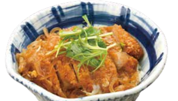
カツ丼セット 1,260円【税込】