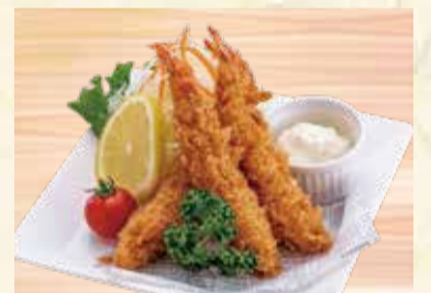
エビフライタルタルソース 3本 800円【税込】