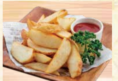
ポテトフライ 410円【税込】