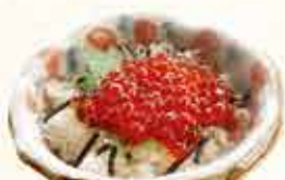
いくら丼 670円 【税込】