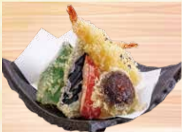
天ぷら盛り合せ 920円【税込】