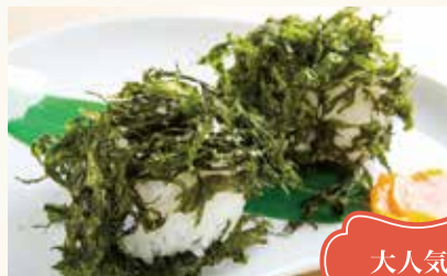
うなぎ 1個 470円【税込】