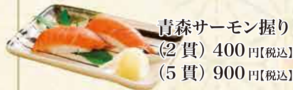
青森サーモン握り (2貫) 400円【税込】 (5貫) 900円【税込】