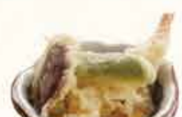
天 丼 580円 【税込】