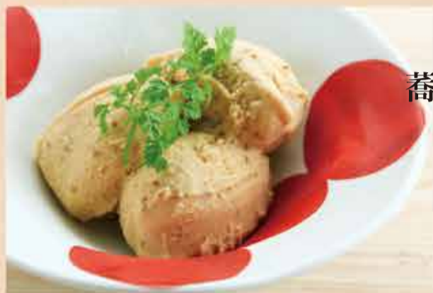
焦がしキャラメルと 蕎麦の実のジェラート 460円【税込】

五穀黒ぜんざいとは… 国産の小豆、大麦、黒米、赤米、黒ごまを国産の粗糖で仕上げた 甘さ控えめで上品な味わいのぜんざいです。