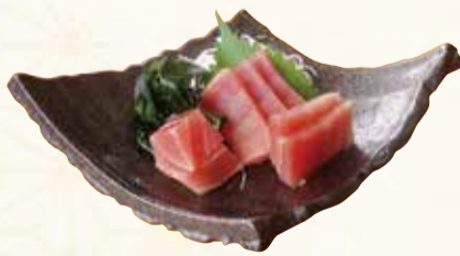
マグロの刺身 1,170円【税込】