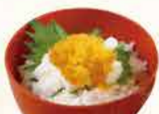
たたき長いも パラ数の子丼 560円 【税込】