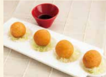
ぎょうざボール 460円【税込】