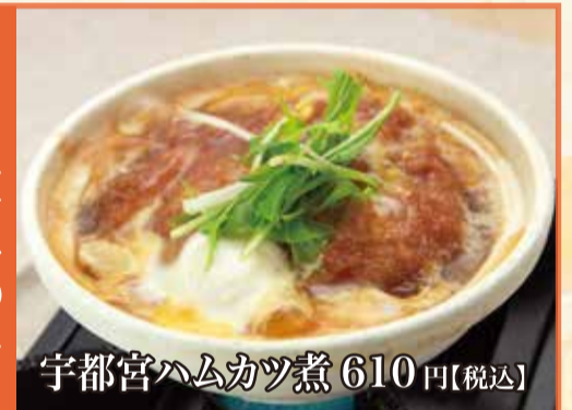
宇都宮ハムカツ煮 610円【税込】