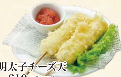
明太子チーズ天 610円【税込】