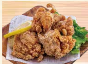
鶏の唐揚げ 680円【税込】