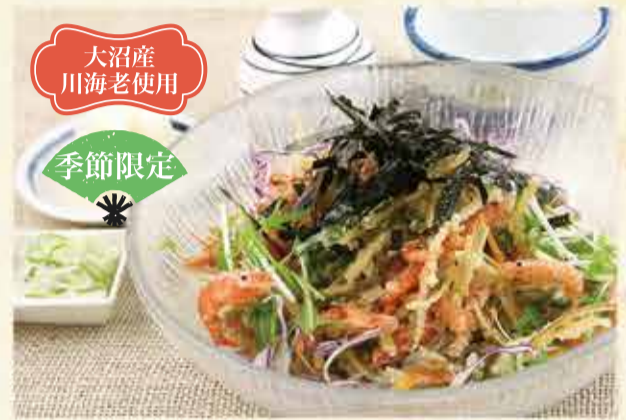
川海老天ちらしおろしそば 1,430円 【税込】