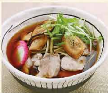
肉そば 1,270円 【税込】