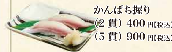
かんぱち握り (2貫) 400円【税込】 (5貫) 900円【税込】