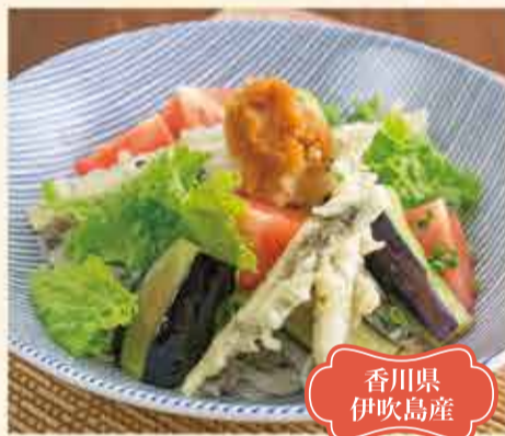
釜揚げ いりこの天ぷらと 揚げ茄子おろしそば 1,170円 【税込】