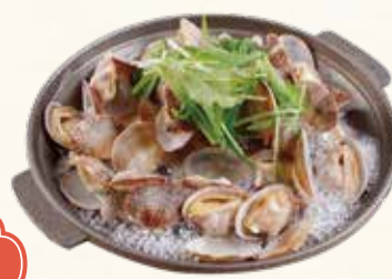
あさりの酒蒸し 800円【税込】