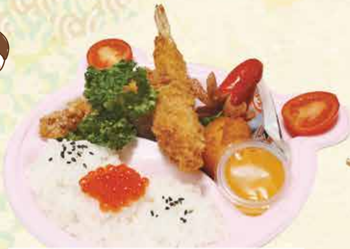
くまちゃん弁当 690円【税込】