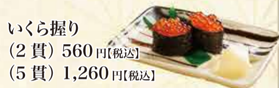
いくら握り (2貫) 560円【税込】 (5貫) 1,260円【税込】