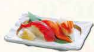
寿司三貫 570円 【税込】

※おそばの大盛りは+300円 【税込】 です。 ※季節によって使用する旬の食材が異なります。 ※表示は税込価格です ※写真はイメージです。