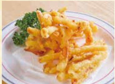
さぎいかフライ 590円【税込】