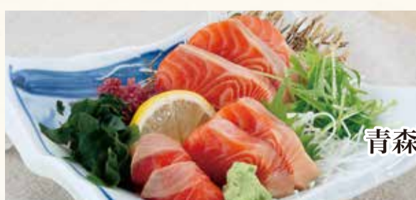
青森県産 青森サーモン刺身 1,350円【税込】