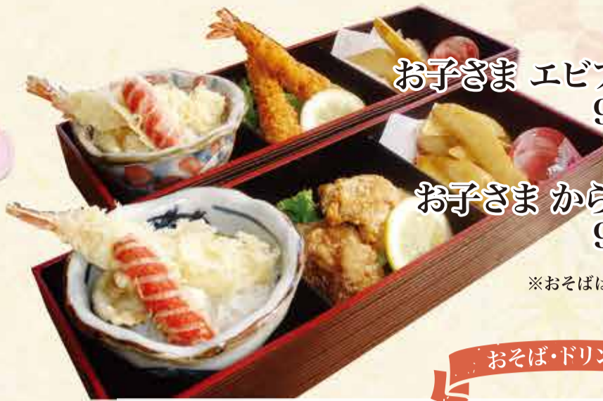
お子さま エビフライ弁当 940円【税込】