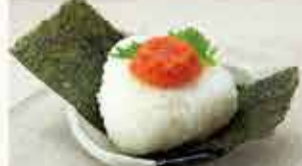
明太子おにぎり 360円 【税込】