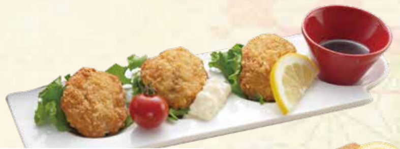
カキフライ 780円【税込】