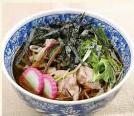
かしわ山菜そば 1,150円 【税込】