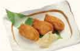
ミニいなり寿司 310円 【税込】