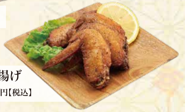
鶏手羽の炙り揚げ 5ヶ 810円【税込】