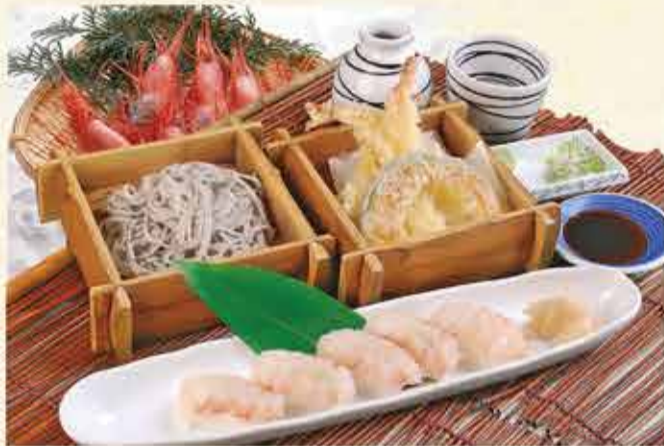
海老づくしセット 2,040円【税込】