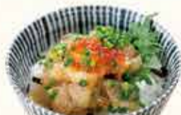
高知県産 活〆ミニ鯛漬丼 730円 【税込】