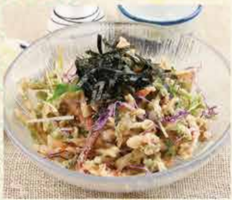
イカげそ天ちらしおろしそば 1,070円 【税込】