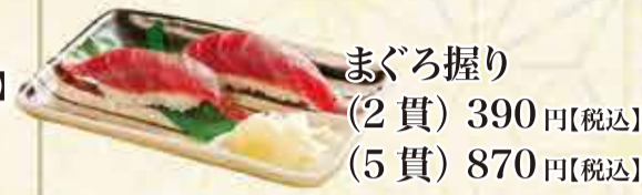
まぐろ握り (2貫) 390円【税込】 (5貫) 870円【税込】