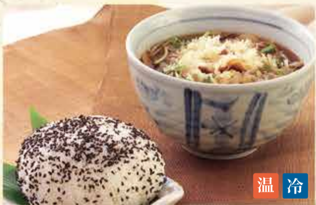
馬車追いそば 1,200円 【税込】