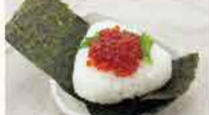
筋子おにぎり 500円 【税込】