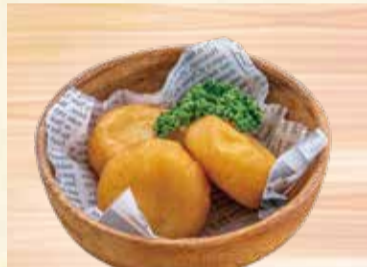
チーズポテトもち 3ヶ 560円【税込】