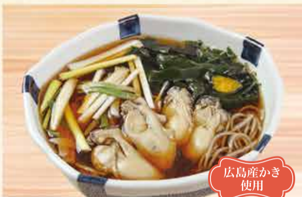
かきそば 1,350円 【税込】