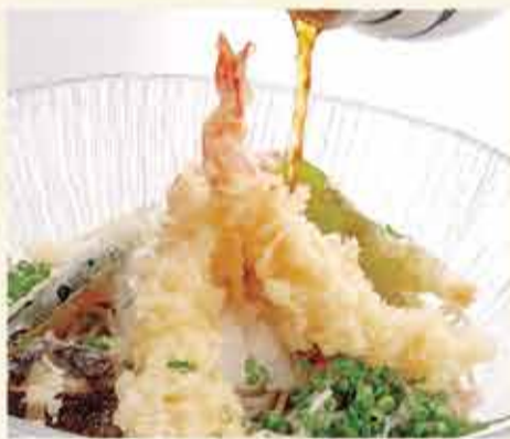
ぶっかけ天おろしそば 1,500円 【税込】