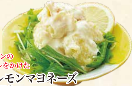
エビのレモンマヨネーズ 750円【税込】