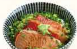
ミニ炙り青森 サーモン丼 700円 【税込】