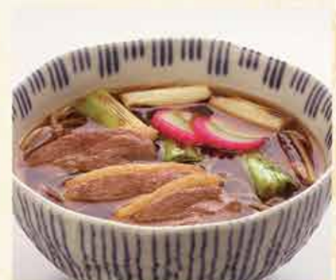
鴨南蛮そば 1,540円 【税込】