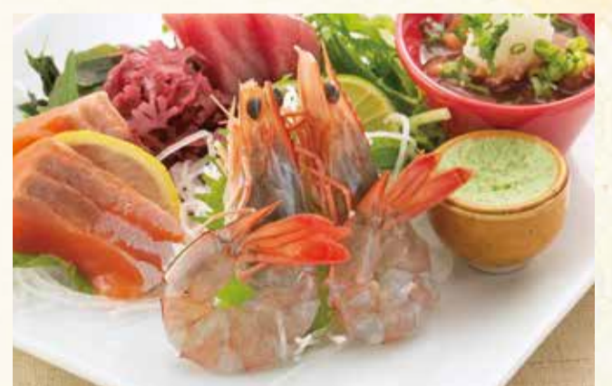
天使の海老刺盛 1,580円【税込】

南太平洋の楽園ニューカレドニアの徹底した衛生管理により安全な海水で育ちました。添加物を一切使わず自然食のみで養殖されている世界最高品質の海老です。