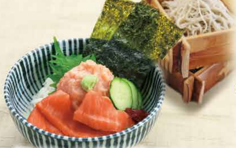
鮭とろサーモン丼 1,230円【税込】