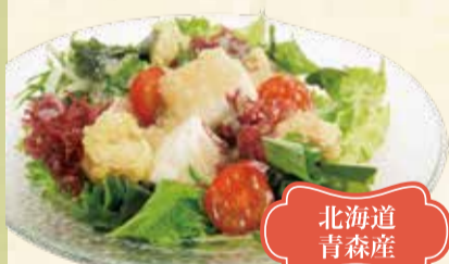
北海道青森産 ベビーホタテと豆腐のオニオンサラダ 700円【税込】

ひめ 姫にんにく においが残りにくいのが特徴。水耕栽培だから芽も根もまるごと食せます。