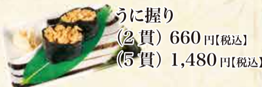
うに握り (2貫) 660円【税込】 (5貫) 1,480円【税込】