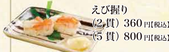
えび握り (2貫) 360円【税込】 (5貫) 800円【税込】