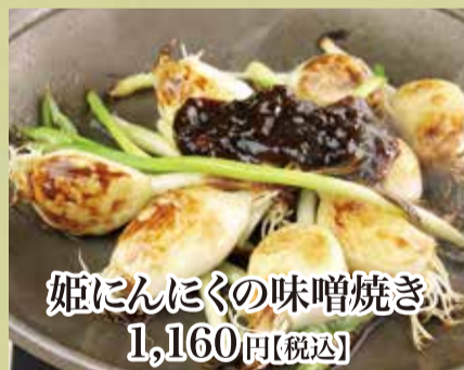
姫にんにくの味噌焼き 1,160円【税込】

ひめ 姫にんにく においが残りにくいのが特徴。水耕栽培だから芽も根もまるごと食せます。