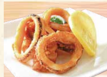
いかリングフライ 680円【税込】