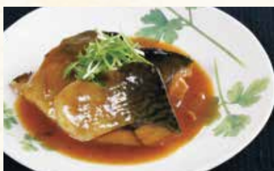
サバの味噌煮 2切 670円【税込】