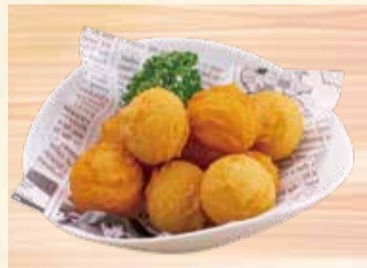
ジャガポテコロッケ (チーズ、カレー味) 510円【税込】