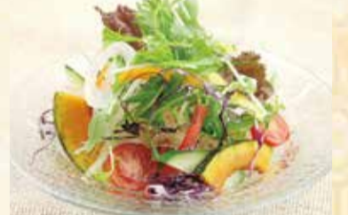
野菜サラダ 630円【税込】