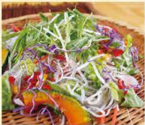
野菜たっぷり野良そば 1,110円 【税込】