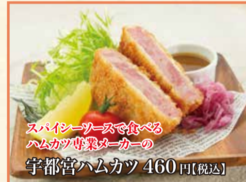
スパイスソースで食べるハムカツ専門メーカーの宇都宮ハムカツ 460円【税込】