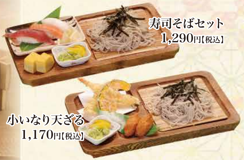
寿司そばセット 1,290円 【税込】