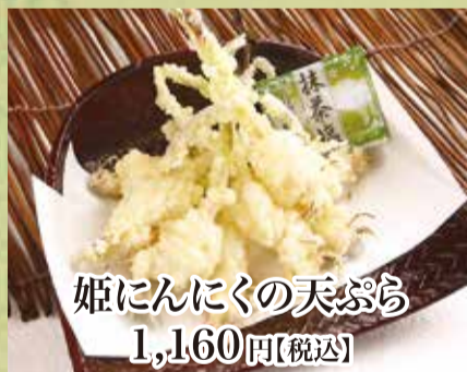
姫にんにくの天ぷら 1,160円【税込】