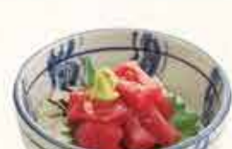
まぐろ丼 610円 【税込】